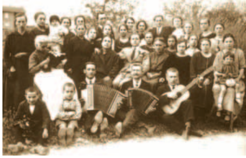
Musica e festa per la fine della stagione dei bozzoli in filanda a Castellazzo (FOTO IN ALTO)

D_ La scelta dei due cd. R_ Avevo proposto all'editore il sistema mp3 che avrebbe consentito di archiviare centinaia e centinaia di tracce sonore, anche se con definizione più bassa.