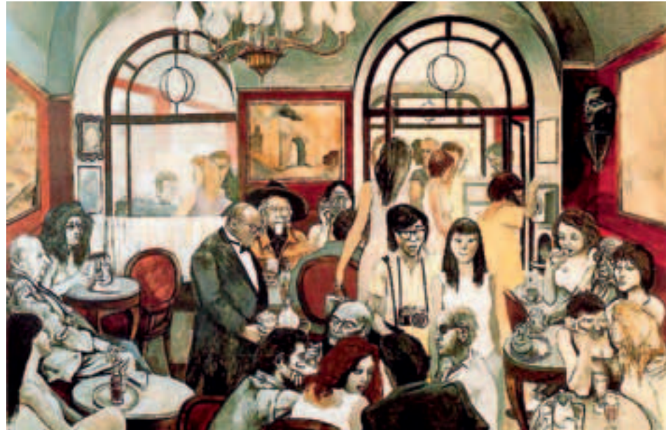
Renato Guttuso Caffè greco

La pubblicazione, curata da Orazio Messina e Milva Gallo rappresenta lo spunto per uno sguardo ravvicinato al significato assunto dall'associazionismo nel vivere quotidiano. In una società dove la vita degli individui si è notevolmente annullata, dove anziani e non più giovani costituiscono una percentuale schiacciante della popolazione, è inevitabile che le risorse aggregative e ricreative diventino una forza per la col-