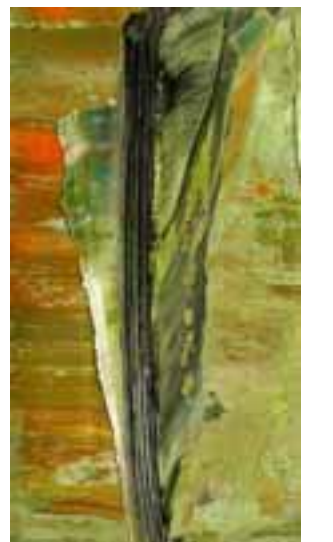
Raffaele Cioffi Impronte

... Probabilmente la soluzione adottata dalla galleria Alexander Alvarez risulterà vincente. Si tratta semplicemente di sviluppare delle sinergie collaborando con delle istituzioni pubbliche in modo da creare un avvenimento espositivo e per proprio in due - o più - momenti a fruitori differenti. È il caso dell'interessante mostra dedicata a Raffaele Cioffi. Questo artista, assai considerato dalla critica, nato nel 1971 a Desio, è soprattutto attivo nell'area lombarda, vantando numerose esposizioni a partire dalla fine degli anni Ottanta. Qualche mese fa è stata organizzata una mostra in Veneto presso il Museo nazionale d'arte moderna di Villa Pisani, mostra in due fasi (a Strà, sede del museo e a Alessandria) alla realizzazione della quale ha collaborato anche la galleria alessandrina, presso cui sono attualmente esposti i lavori di Cioffi, gli stessi presentati nel prestigioso museo. È una mostra di pittura nel senso più tradizionale e ciò che si può vedere è frutto di una ricerca che procede ormai da alcuni anni. È una ricerca impostata sul colore e sulla materia. Cioffi ha cominciato a riflettere sugli esiti del colore lavorando su variegate strisciate cromatiche verticali e orizzontali. In quel momento le opere erano perfette nella loro tessitura, formulate secondo precisi condizionamenti di equilibrio interno. Sembrava che il pittore si sforzasse di eliminare ogni e-